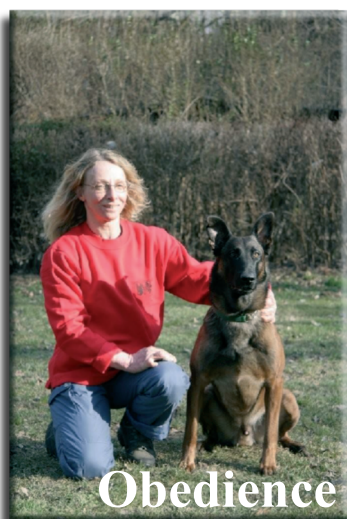
Obedience - Mannschaft