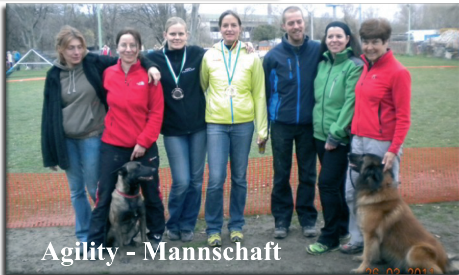
Agility - Mannschaft