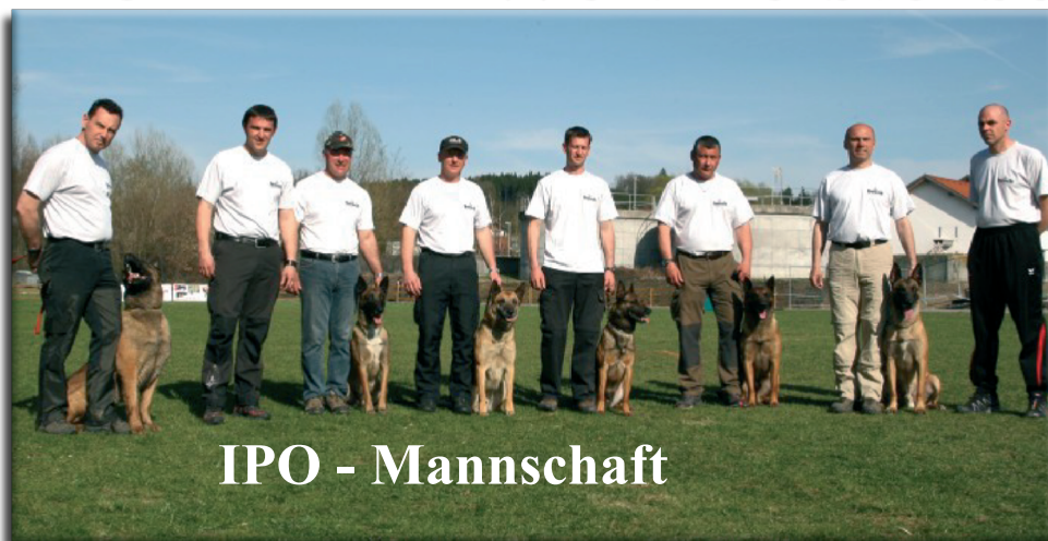
IPO - Mannschaft