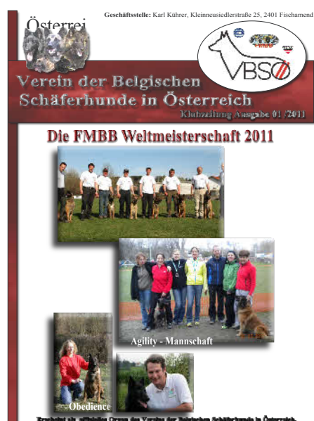
Die VBSÖ - Mannschaft für die FMBB WM 2011