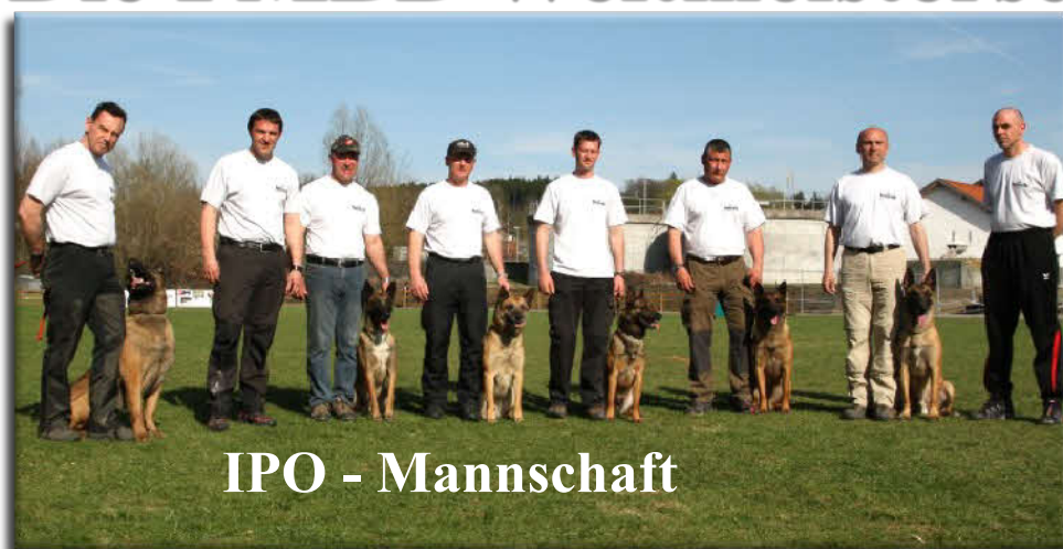
IPO - Mannschaft