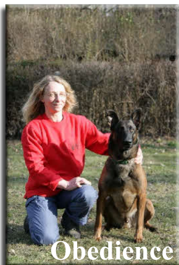
Obedience - Mannschaft