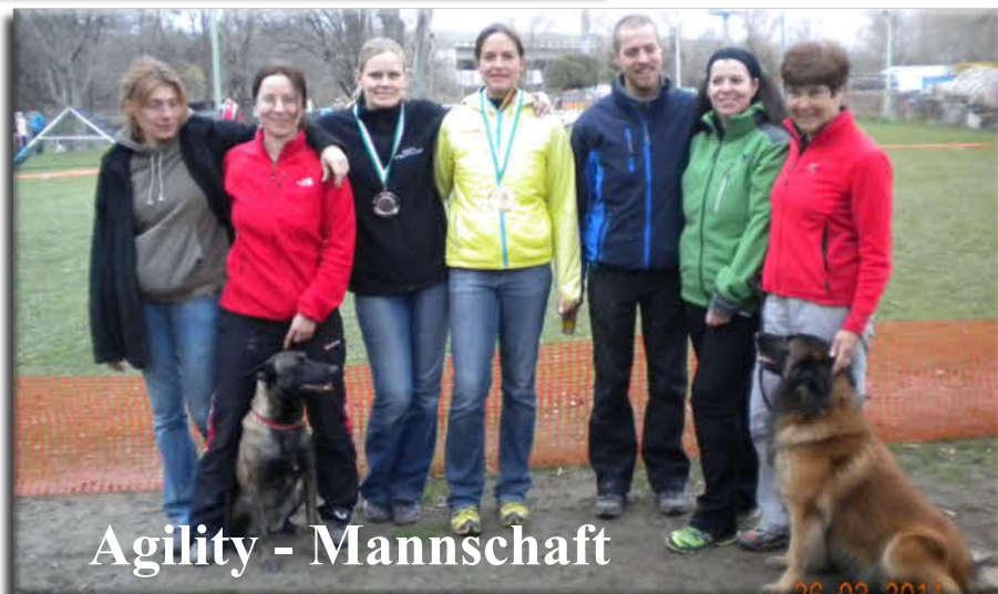
Agility - Mannschaft